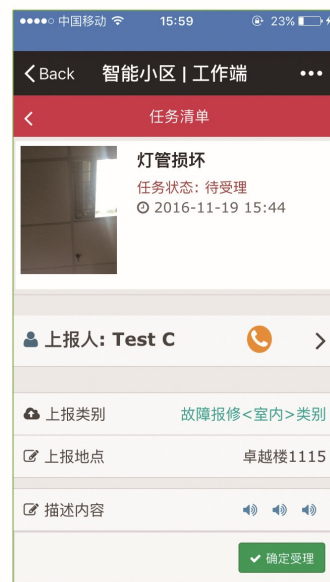
工作人员-任务详情页面