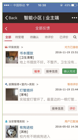
业主-信息上报状态页面