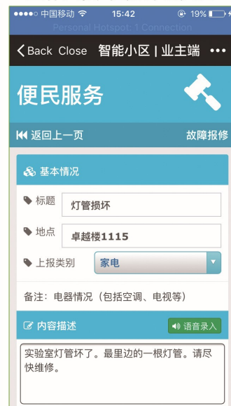
业主-信息上报页面